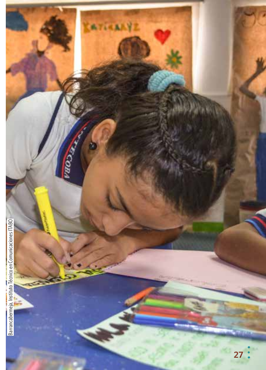
Barrancabermeja. Instituto Técnico en Comunicaciones ITABO

Adicionalmente esta actividad de cierre debe hacer conciencia sobre la importancia de indagar en el territorio como una manera de comprender lo que nos rodea integrando y entendiendo las maneras de ver el mundo de los demás.