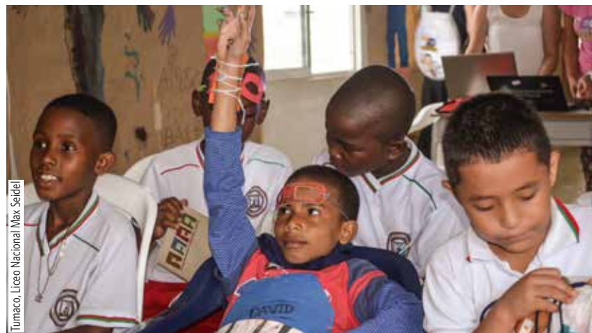
Tumaco. Liceo Nacional Max Seidel