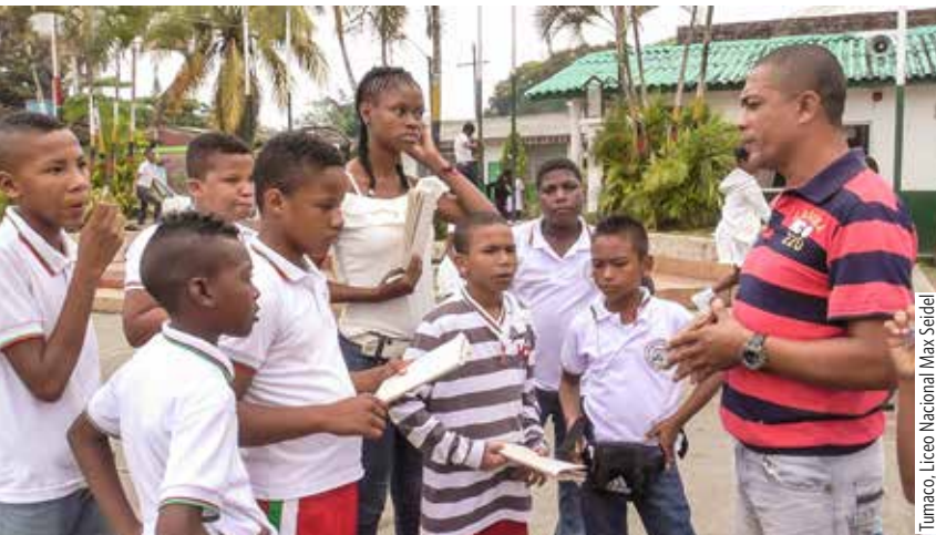
Tumaco, Liceo Nacional Max Seidel