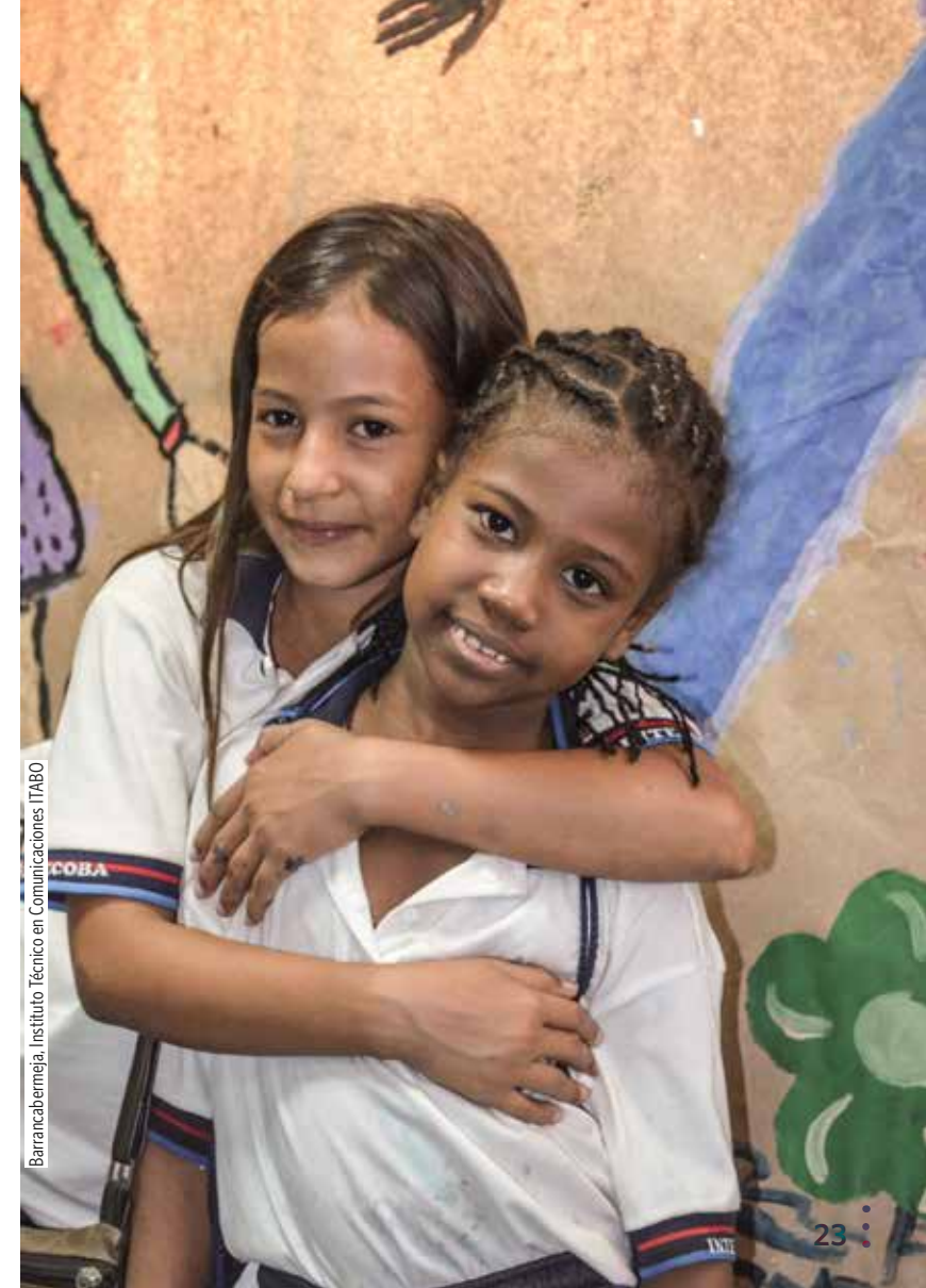
Barrancabermeja, Instituto Técnico en Comunicaciones ITABO

Para esto se les pregunta a los participantes ¿Qué es lo que más les gusta hacer? O qué es eso en lo que sienten que son muy buenos y les gustaría mostrar a otros. A través de un juego o actividad escogen una pareja con quien trabajar. La idea principal es que cada pareja se preste ayuda mutua y graben en video: un Tutorial.