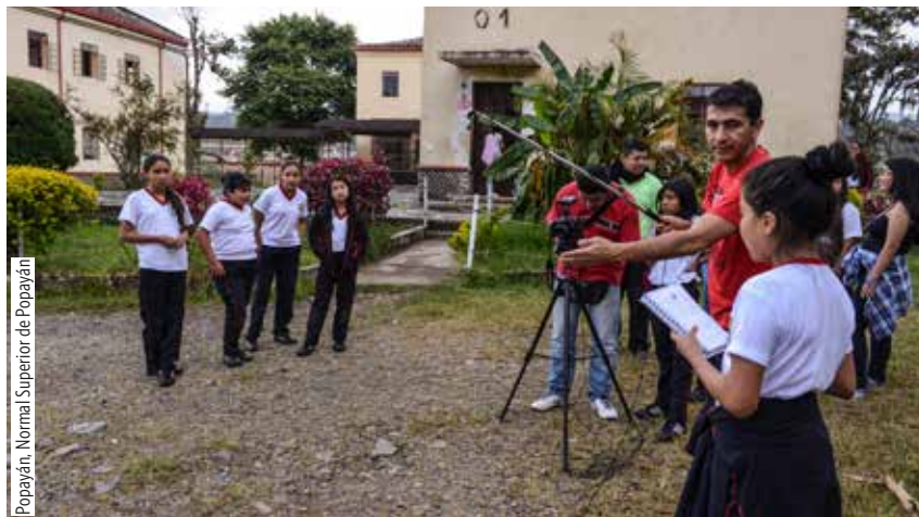
Popayán, Normal Superior de Popayán