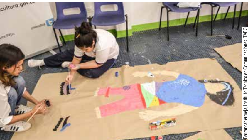
Barrancabermeja, Instituto Técnico en Comunicaciones ITABO