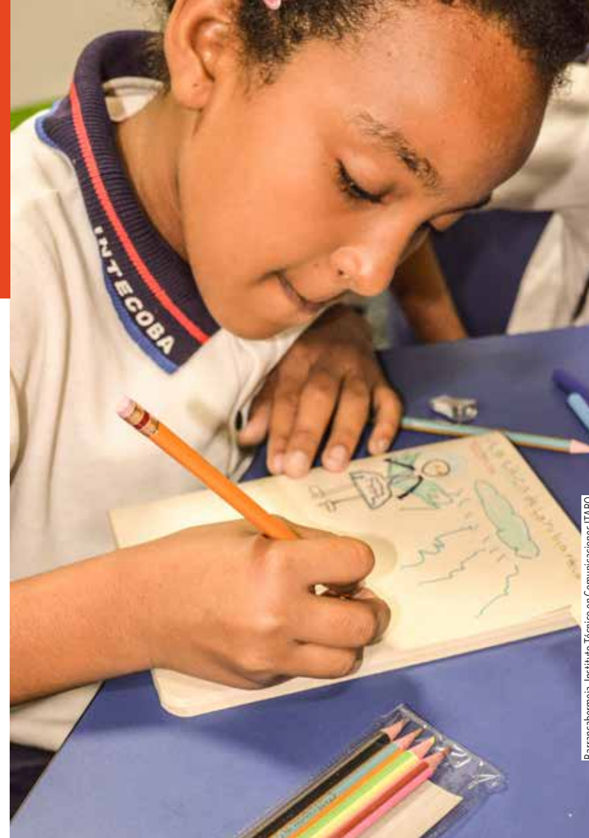
Barrancabermeja, Instituto Técnico en Comunicaciones ITABO