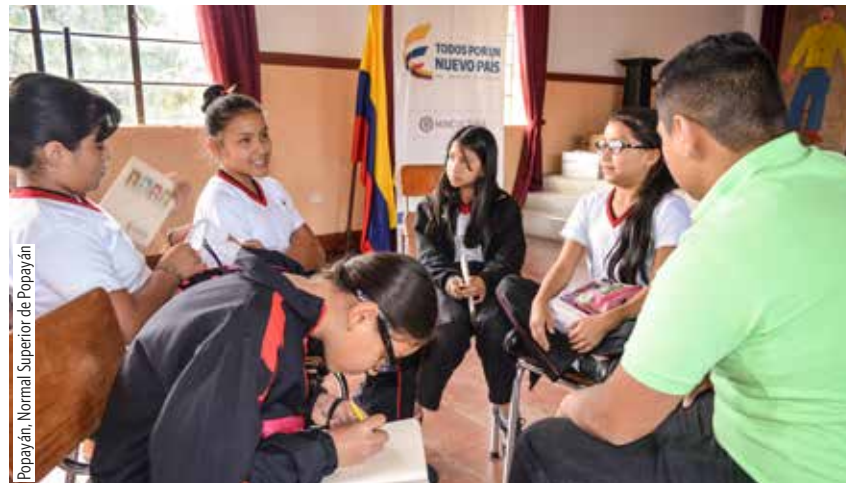
Popayán, Normal Superior de Popayán