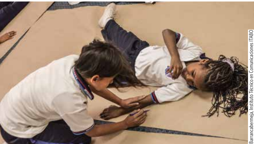
Barrancabermeja, Instituto Técnico en Comunicaciones ITABO