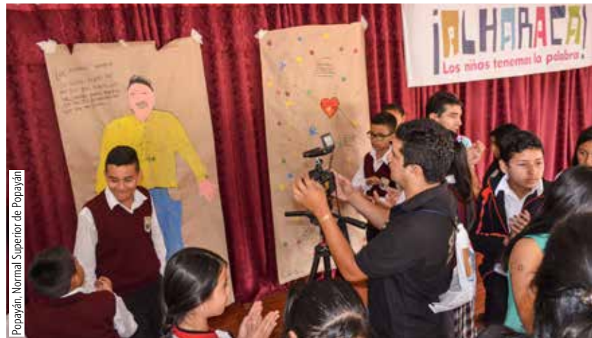
Popayán. Normal Superior de Popayán