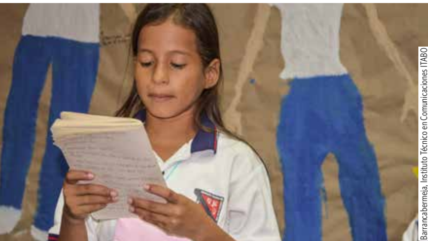
Barrancabermeja. Instituto Técnico en Comunicaciones ITABO