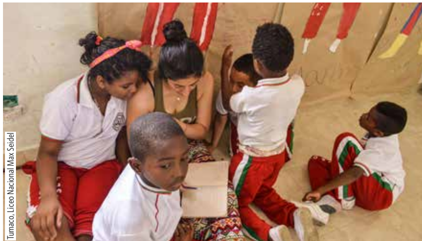
Tumaco, Liceo Nacional Max Seidel