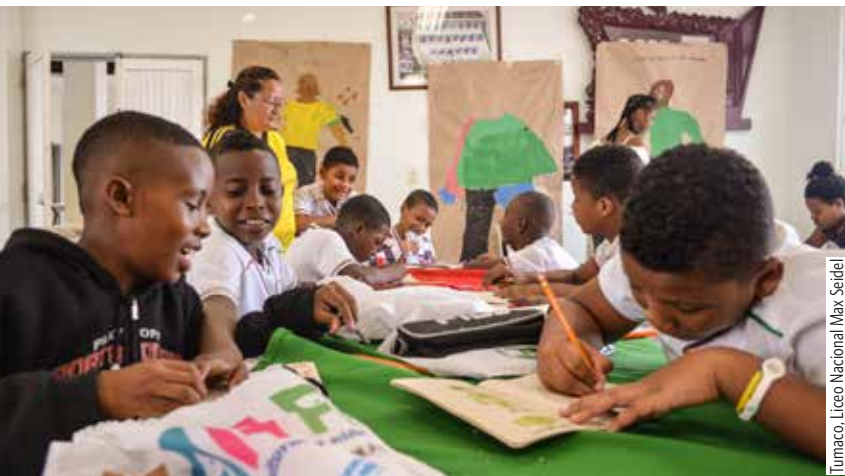
Tumaco, Liceo Nacional Max Seidel