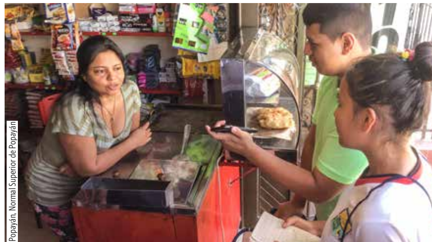
Popayán, Normal Superior de Popayán