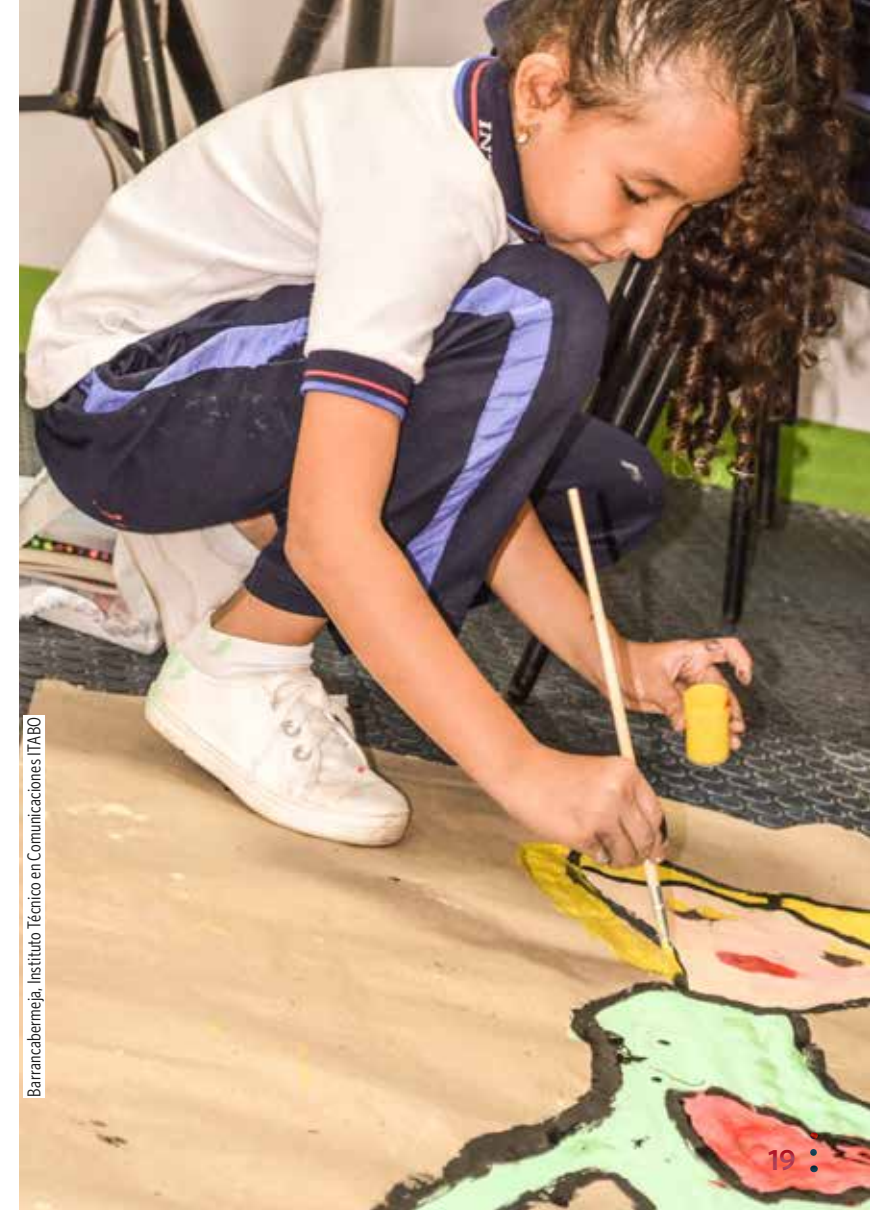
Barrancabermeja, Instituto Técnico en Comunicaciones ITABO