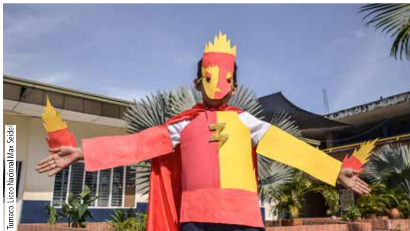
Tumaco, Liceo Nacional Max Seidel