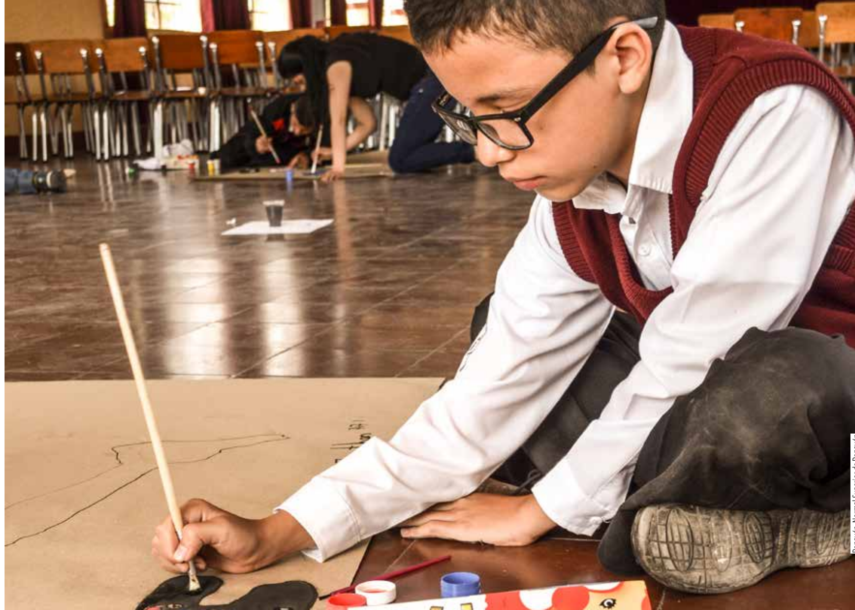
Popayán, Normal Superior de Popayán

A continuación, se describen los cuatro momentos y diversas actividades sugeridas para desarrollar con los niños.