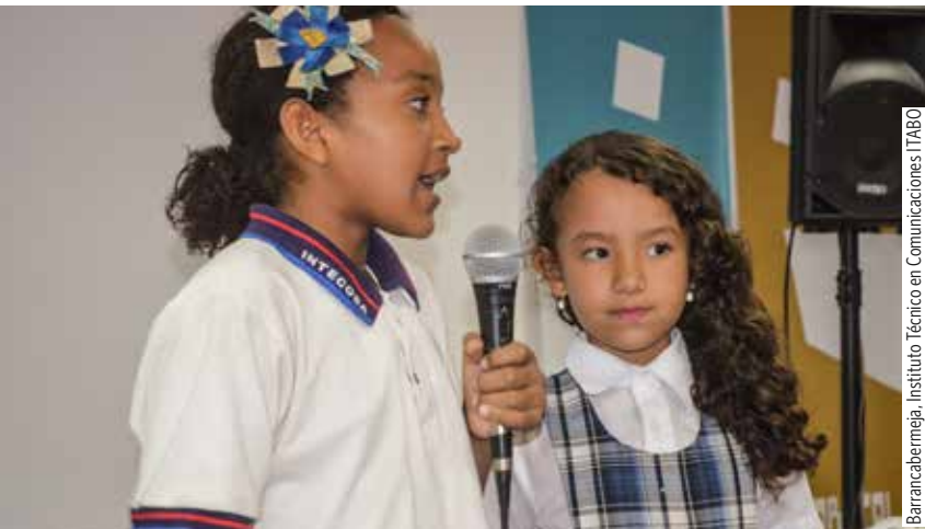
Barrancabermeja. Instituto Técnico en Comunicaciones ITABO