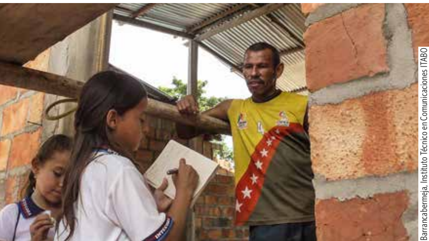
Barrancabermeja, Instituto Técnico en Comunicaciones ITABO