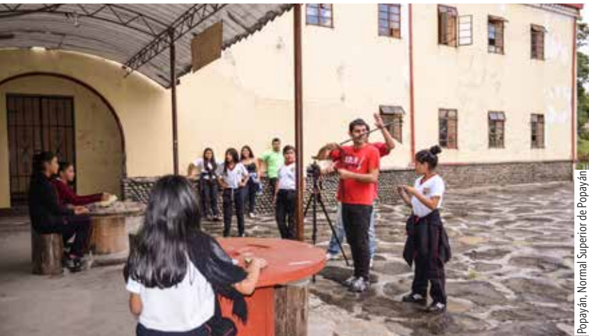
Popayán, Normal Superior de Popayán