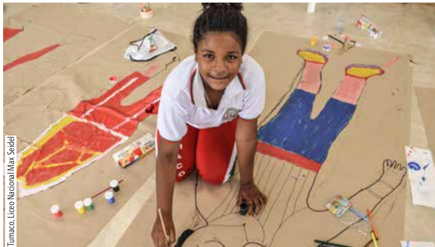
Tumaco, Liceo Nacional Max Seidel